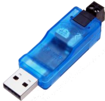
KNX USB Interface Stick 332

Portables USB Interface in Stickform für den KNX-Bus